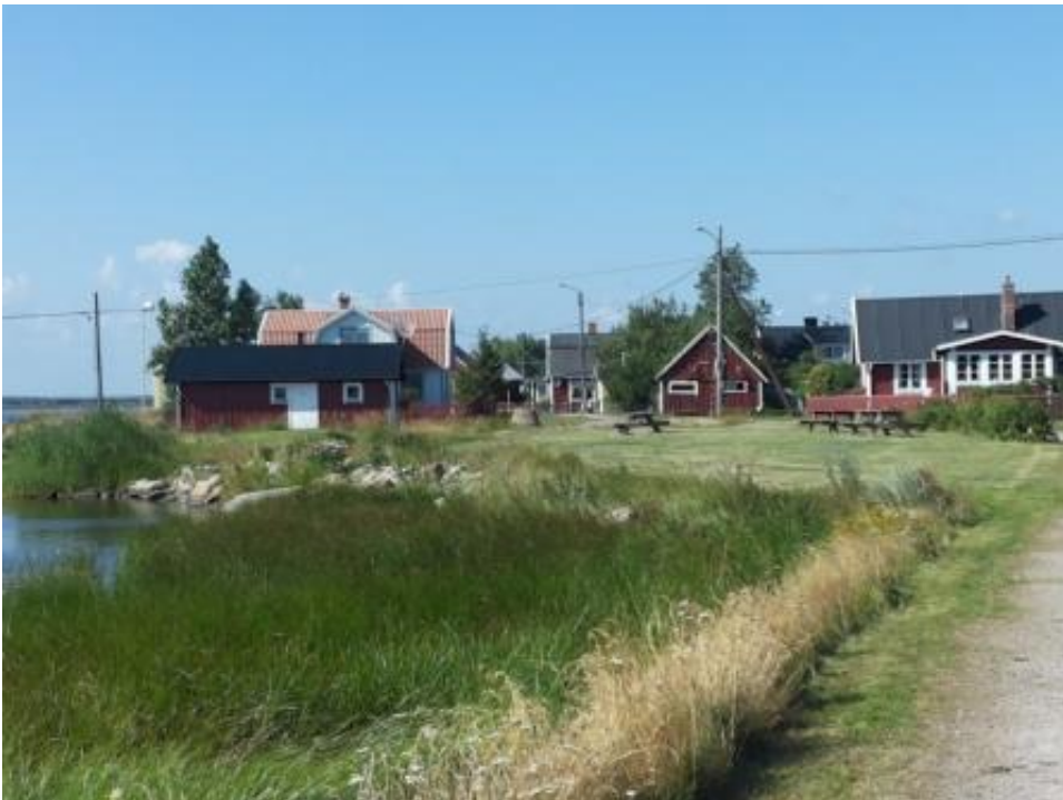
Hus vid hamnen